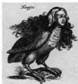
Gravur von 1660

aus: Vollmers Wörterbuch der Mythologie, Stuttgart 1874